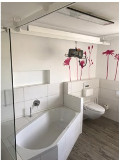
Auch für enge Räume: Traversensystem