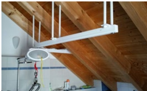
Installation unter einer Dachschräge mit Holzdecke

Kostenlose und unverbindliche Beratung bei Ihnen vor Ort. Mit der Möglichkeit zum Testen. Ihren Ansprechpartner vor Ort finden Sie auf unserer Website: