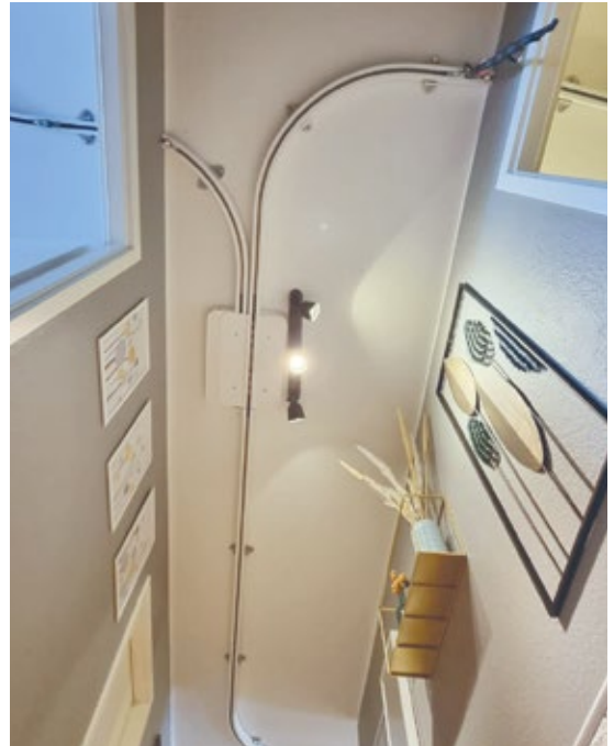
Von Raum zu Raum über Kurven und Schwenkweiche