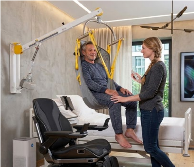
Wandlifter mit Schwenkarm