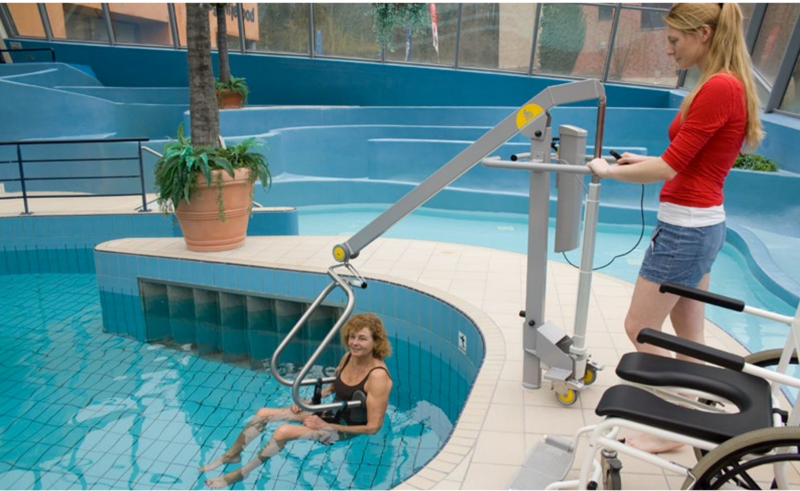
∨ Schwimmbadlifter mit Hehebügel